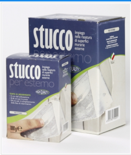
Stucco polvere riempimento per esterno.